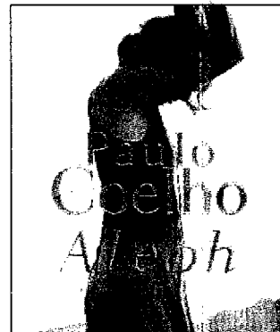
La copertina del nuovo romanzo di Paulo Coelho (nella foto in alto)