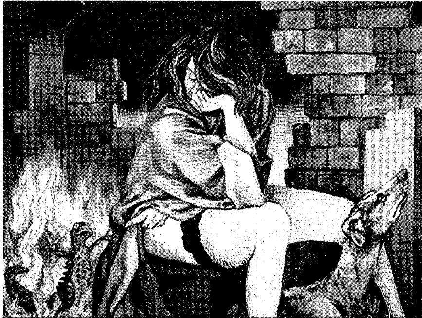
«Strega malinconica», olio su tela di Renato Guttuso (1912-1987) dipinto nel 1982