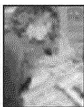
Adolescenti e libri