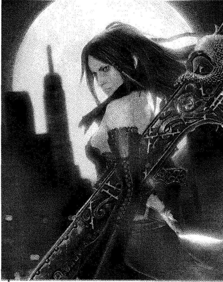
Una strega, metafora dell'inquietudine che incombe sul nostro tempo. Sotto, Paulo Coelho