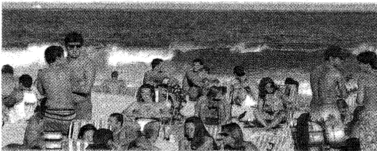
Una veduta della spiaggia di Rio de Janeiro